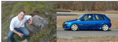
Ludovic Buono sur Citroën Saxo Gr.N2