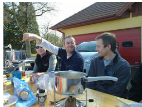
Anneau du Rhin - la fondue