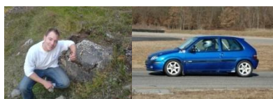
Ludovic Buono sur Citroën Saxo Gr. N2