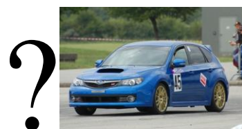
Martial Macherel (pilote potentiel) sur Subaru WRX STi Gr. SuperSerie Compétition