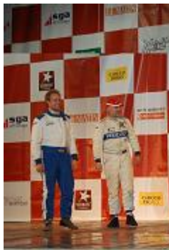
Cornuz/Cornuz au Valais