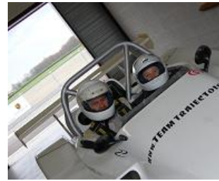
Un fiston aux anges