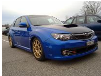
Une bien belle soub