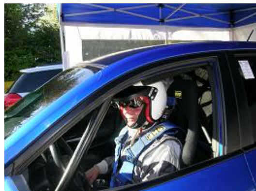
Ch'sais pas vous, mais moi chu prêt !