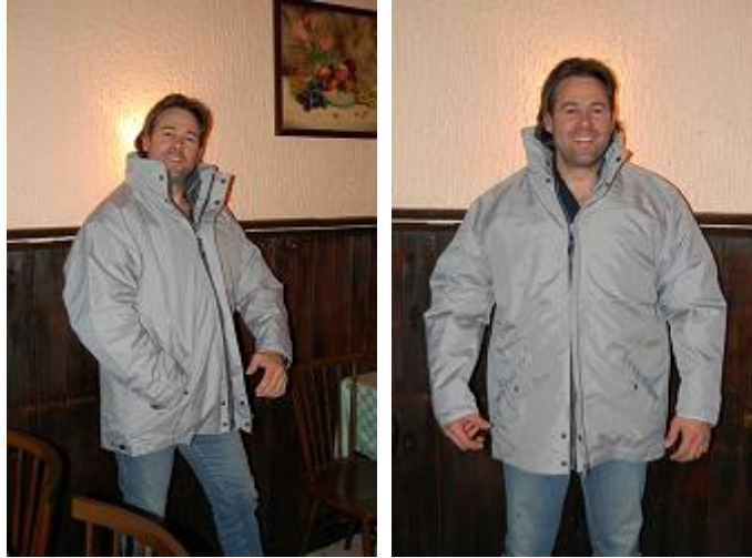
vestes d'hiver multi-fonctions avec polaire et manches détachables ... pour CHF 130.-

Tous les articles du team se trouvent sur le site internet dans la rubrique boutique . Vous pouvez également y faire une commande.