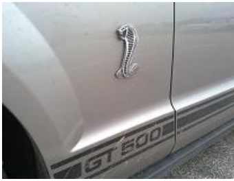
Une belle bête à Bresse !!!