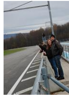
Toujours les mêmes qui font des théories de bord de piste... ;-))