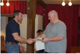
Belle remise des prix !!!