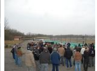
Le briefing obligatoire que tout le monde suit avec attention !