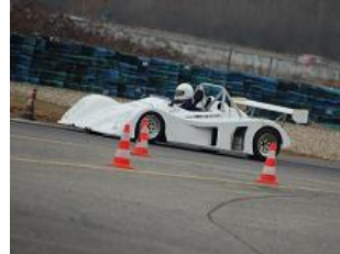
Un proto qui devient bien fiable