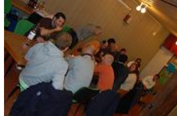
Heeuu mais c't'ambiance autour d's'te table !!!