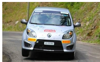
Buono-Villars à l'attaque !