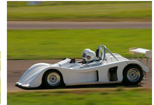
Session découverte pour certains !