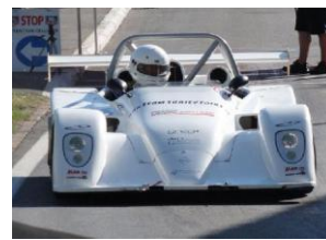
Le Did à Massongex !