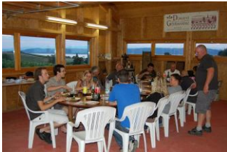
Du beau monde à la Broche !!!