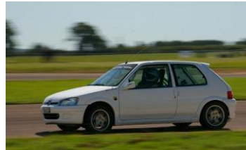
Un bolide qui se fait rare sur les circuits !