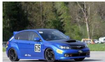
Martial en pleine attaque