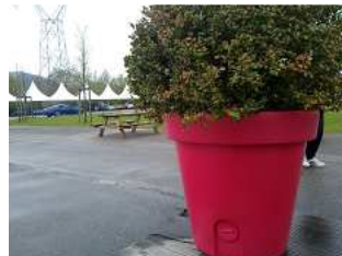
En voilà un qui aura plus qu'apprécié cette pluie !