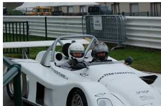
Qu'ils étaient courageux, mais toujours avec le sourire ;-)