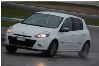
Une Clio sans doute plus facile à piloter qu'une V6