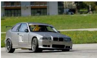
Ça lève la patte ! Bôô ça !