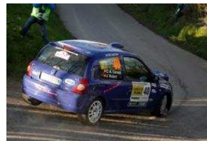
CLAC au volant d'une Clio Gr.N