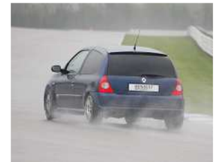
Les tractions à l'honneur par cette météo !