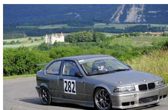
Co à Chamblon !