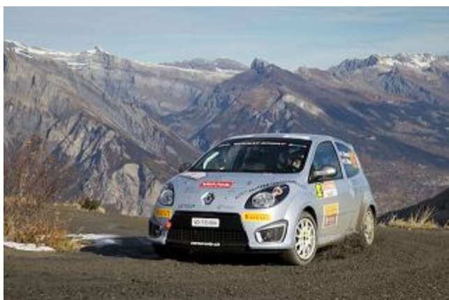
Une photo un peu plus grande pour Ludo, histoire qu'on l'encourage pour sa future saison et la reconstruction de sa Twingo R1.