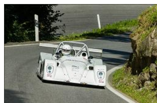
Did à Massongex !