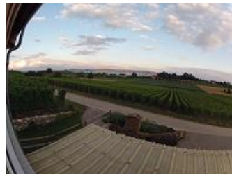
Mais c'te vue !