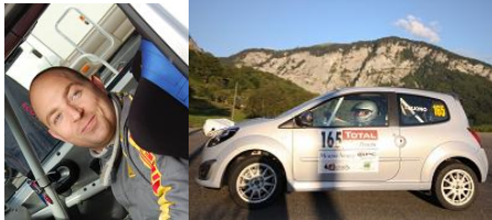
Ludovic Buono sur Renault Twingo RS Gr. R1