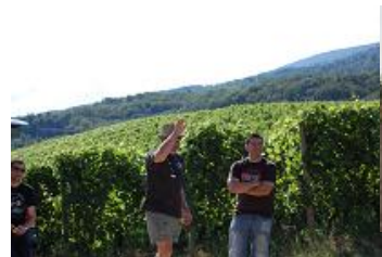
On admire le président !