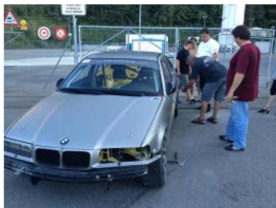
Quoi de plus beau qu'un peu d'entraide entre pilotes !