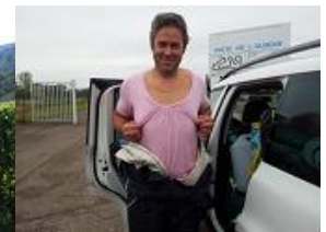
Et on réadmire le président !