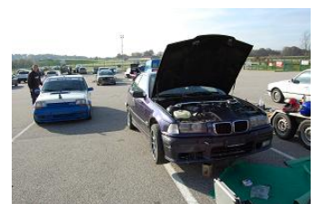
Laquelle qui est sur les chandelles... hein?