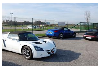
Le coin des toits souples !