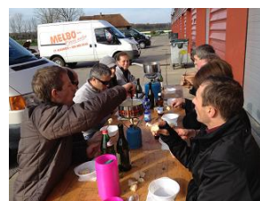
Nickel la fondue du président on en redemande!