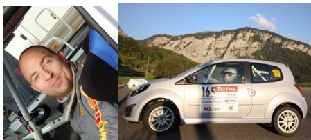
Ludovic Buono sur Renault Twingo RS Gr. R1