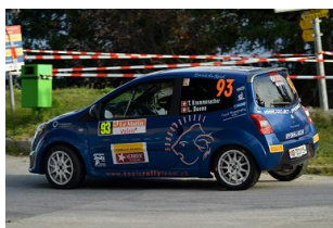
Ludo au Rallye du Valais comme navigateur

Corinne Candaux, NAT, BMW Compact, E1/+3000cc 3:27.79, 4e classe/6, 25e groupe/39, 48e scratch/106