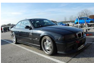
Noir c'est noooooiiiiir... il n'y a plus d'espoir....