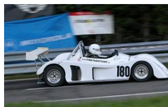
Le Did au Gurnigel !