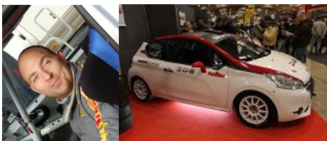
Ludovic Buono sur Peugeot 208 Gr.R2