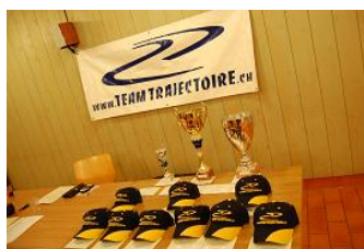
Magnifique remise des prix qui s'annonce !