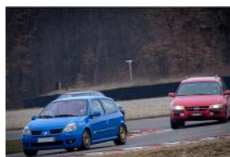
A la chasse aux françaises !