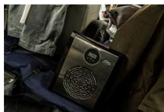
Tu dis qu'il faisais froid ?