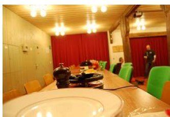
En attendant la foule !