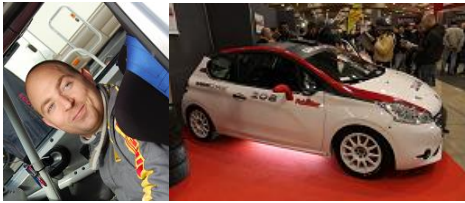
Ludovic Buono sur Peugeot 208 Gr.R2