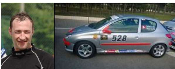
Fabrice Oulevey sur Peugeot 206 GTi RPS