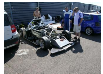
Le proto aussi tombe le haut !