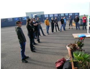
Les pilotes sont hypnotisés ...