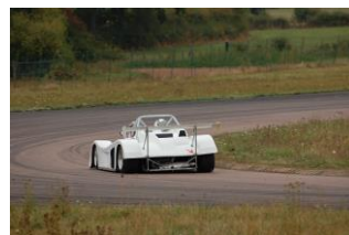
Full attack !