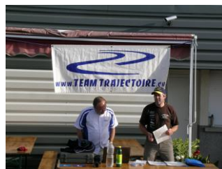
... par les gourous du briefing !