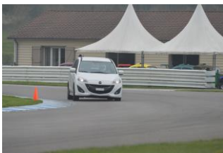
Il y en a eu pour tous au Laquais...