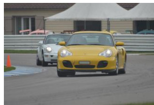
...du débutant au plus averti !