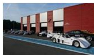
La belle brochette !