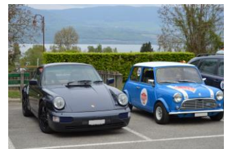
En direct du Cornuz Rally Tour !