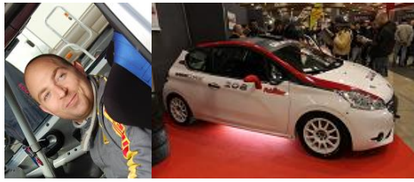
Ludovic Buono sur Peugeot 208 Gr.R2B