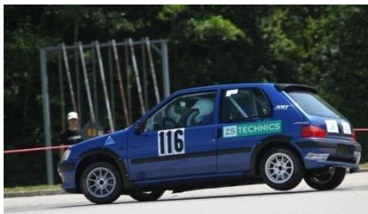
Yann Rohrbach sur Peugeot 106GTi Gr. N2