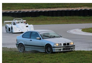
...dernier moment pour tondre la pelouse !