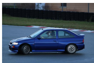
Que de maîtrise