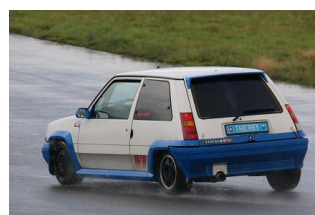
Du plaisir, des plus anciennes...