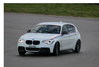
...aux plus récentes !