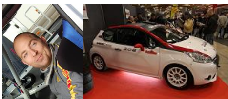
Ludovic Buono sur Peugeot 208 Gr.R2B