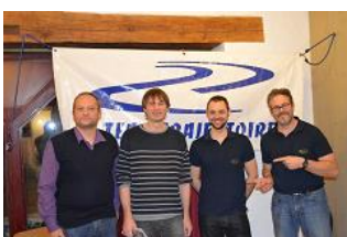
Il n'est pas beau ce podium Challenge Team !