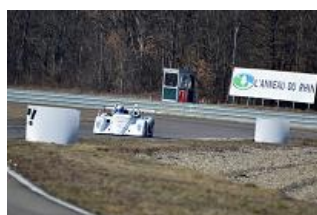
Un proto des plus fiables !