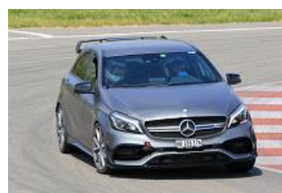
Des pilotes qu'il fait bon revoir sur piste !