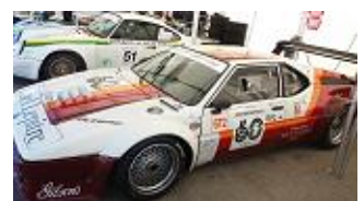
Première excursion du Team au GP de l'Age d'Or à Dijon !