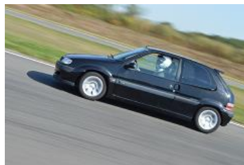
Aurélien Rose sur Citroën Saxo VTS Gr. LOC4