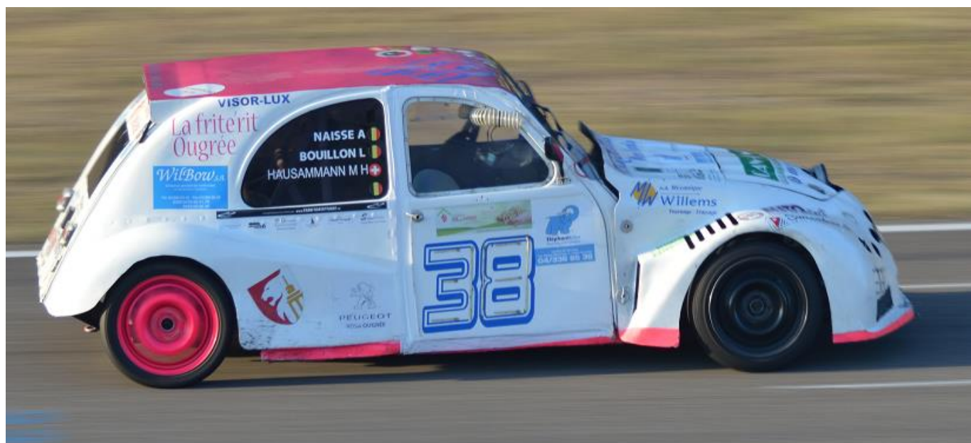
MARC-HENRI HAUSAMMANN LORS DU TROPHEE D'ALSACE / 2CV RACING CUP