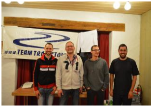
Le podium du Challenge Team !