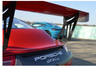
De beaux bolides présents à l'Anneau !