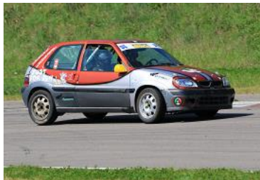
Aurélien Rose sur Citroen Saxo VTS Gr.A