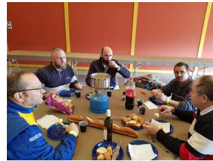
23 personnes à la Fondue ! Un record !