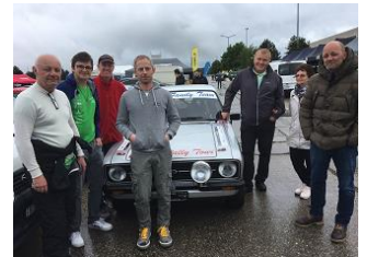
Grillades au Slalom de Bière, super journée malgré la pluie !