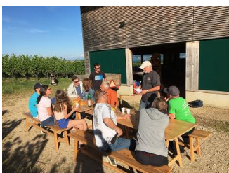
Une broche ludique chez Gourmandaz !