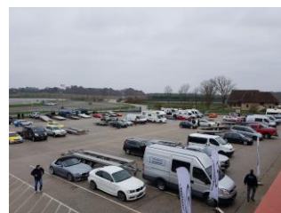
1 paddock bien fourni qui fait plaisir à voir !