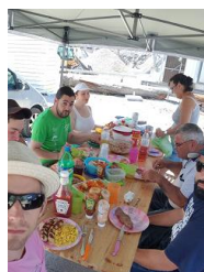
Belle tablée grillade à Massongex !