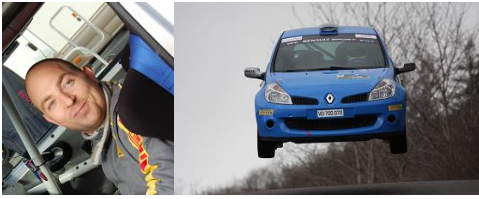
Ludovic Buono Navigateur de Didier Postizzi / Clio3 R3B