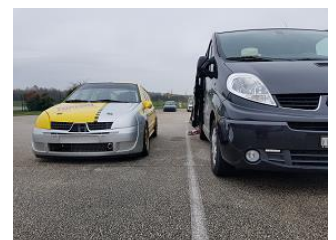
L'occasion pour certains de remettre le pied à l'étrier (de frein ?) !