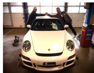
Si on n'ose pas, on ne fait rien !