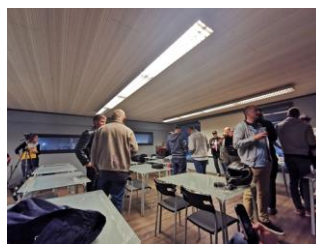
Cette première conférence a eu un succès unanime !