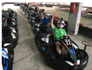
Le karting à Vuiteboeuf : A REFAIRE AU PLUS VITE !